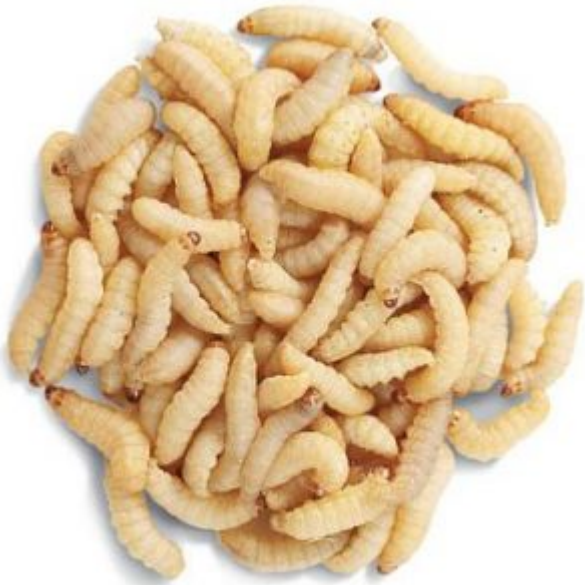
Teigne de ruches