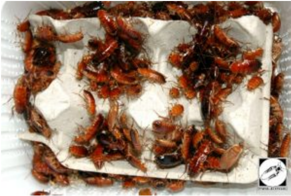
Blatte red runner