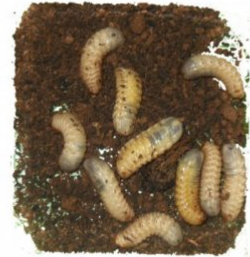
Larves de cétoine (dolas)