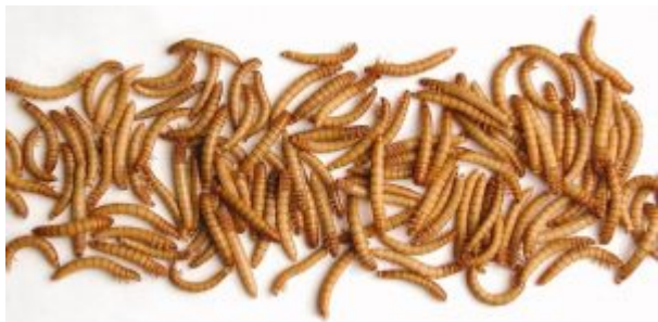
Vers de farine