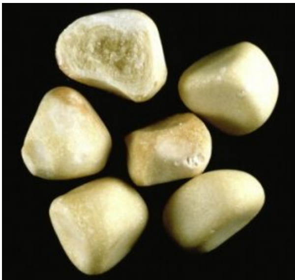
Calculs de cystine, type Vb.

La cystine est une molécule composée de cystéines (acide aminé). Chez l'animal en bonne santé cette molécule est normalement filtré par le rein et envoyé dans l'urine pour être éliminé. Or certaines races canine sont porteurs d'une maladie génétique qui entraîne une accumulation de ces cystines provoquant une cysténurie (²). Pour l'instant une seule anomalie génétique a été identifié .