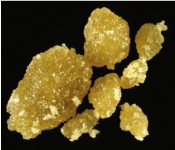
Calculs de cystine, type Va.